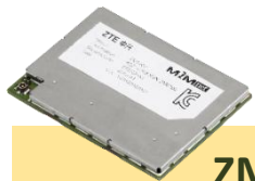
ZM5202 WCDMA Module

项目运作模式：教育部组织招标，最终由运营商提供终端和网络服务，采用三年服务合同期，终端免费向儿童提供，只收取月服务费，而贫困学生的服务费用由教育部承担。追踪的后台系统由教育部找第三方进行开发。